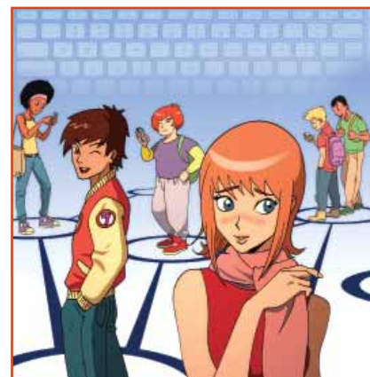
Illustrations : Alfonso Recio