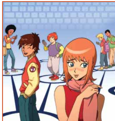
Illustrations : Alfonso Recio

ado, etc., permet d'accéder à des informations mais aussi de dialoguer avec des adultes en préservant son anonymat. Environ 44 % des adolescents recherchent des informations sur la sexualité sur Internet 2 sans toujours les compléter par un dialogue direct avec un adulte, professionnel ou non ;